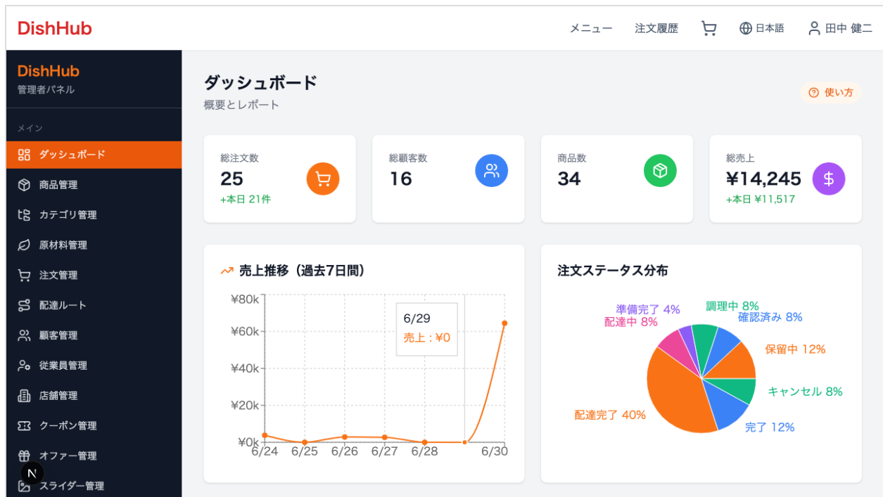
管理者ダッシュボード

△ パスワードが正しくない場合はエラーメッセージが表示されます。ログインできない場合は管理者にアカウント情報の確認を依頼してください。